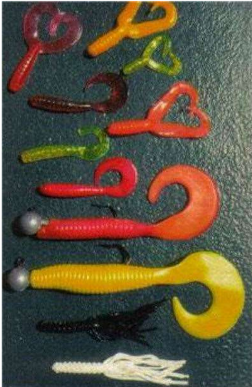
( Ce black-bass mord à une grande variété de leurres souples.)

Dès lors qu'il offre suffisamment d'espace, un même repaire peut abriter plusieurs individus. Toutefois, la certitude d'avoir trouvé un endroit prometteur ne suffit pas, le pêcheur doit surtout s'armer de patience. Celui qui en manie bien la technique peut aussi appâter presque en surface avec des leurres bruyants, de préférence à proximité de possibles cachettes plus en profondeur. Quelle que soit la méthode de pêche choisie, au coup ou à la posée, on utilise en matériel mi-lourd, mais une canne plus rigide convient mieux aux leurres en caoutchouc. D'une manière générale, il faut un fil robuste pour capturer ce poisson combatif au ferrage.